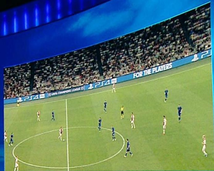
AJAX VS DYNAMO KIJÓW