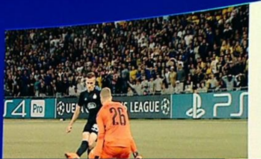
YOUNG BOYS VS DINAMO ZAGRZEB