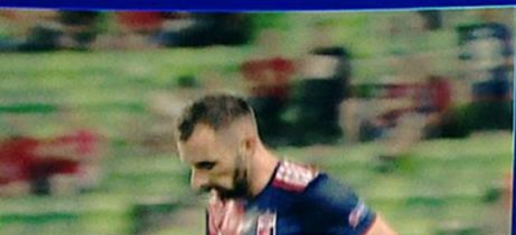
VIDI VS AEK ATENY